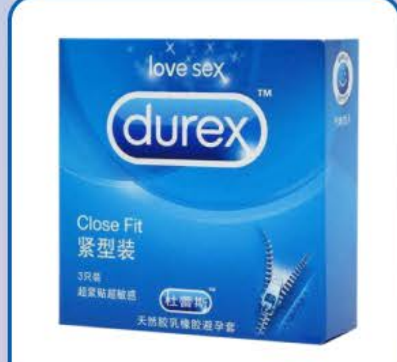
杜蕾斯超薄安全套